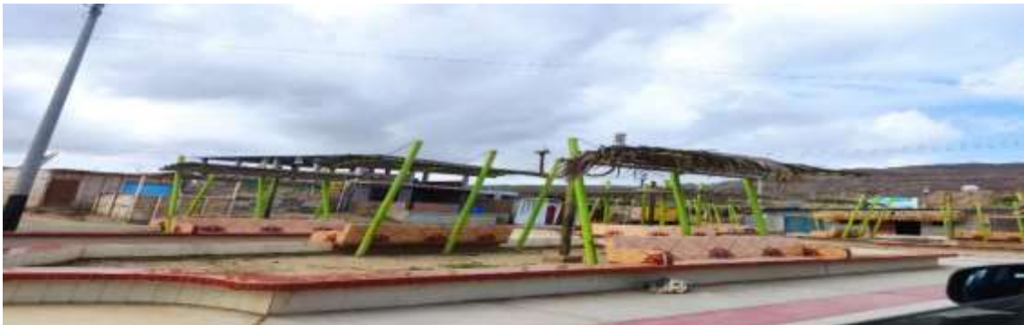
ASENT.H PUEBLO NUEVO

-Según información de vecinos de este distrito de los Órganos, donde se produciría peleas causándose así lesiones, serían los recurrentes a los BARES que están ubicados en el ASENT.H PUEBLO NUEVO, BADEN DEL DISTRITO DE LOS ORGANOS, ASENT.H HUNGARITOS.