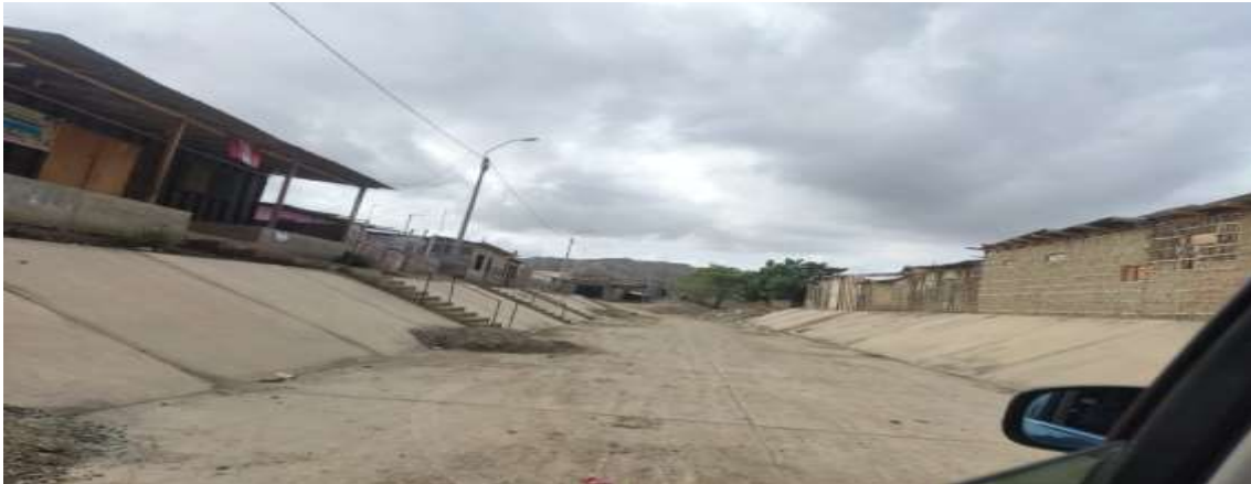
BADEN DEL DISTRITO DE LOS ORGANOS