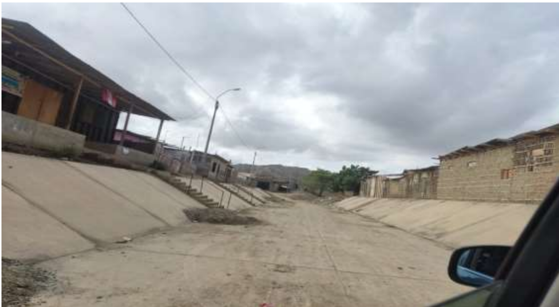
BADEN DEL DISTRITO DE LOS ORGANOS