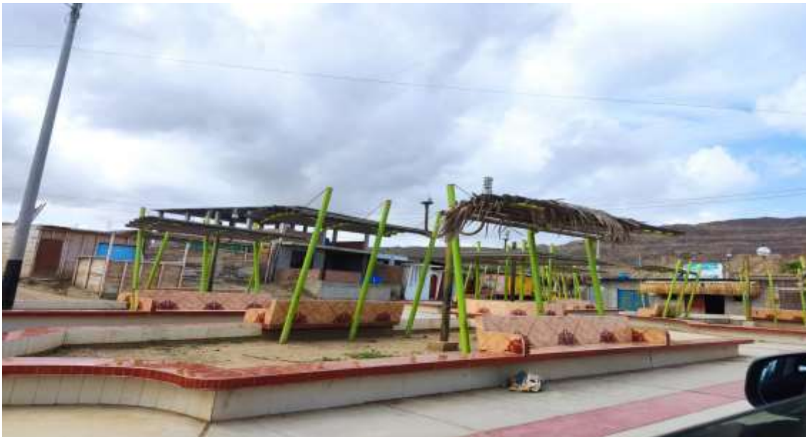
ASENT.H PUEBLO NUEVO