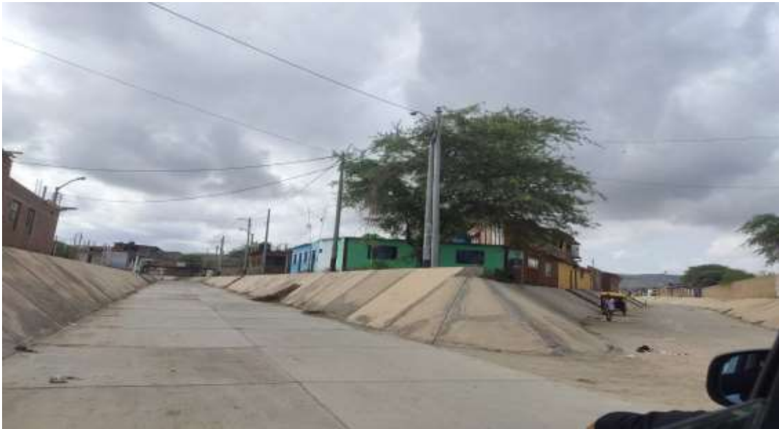
BADEN DEL DISTRITO DE LOS ORGANOS