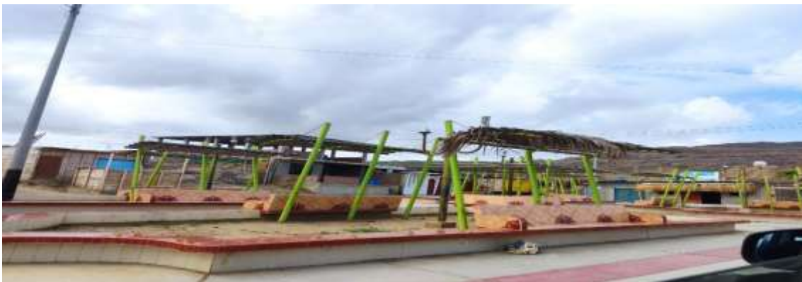
ASENT.H PUEBLO NUEVO