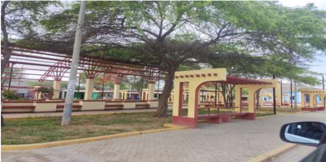
ASENT.H SAN PEDRO